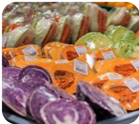
Aprovechamiento (Árbol completo)